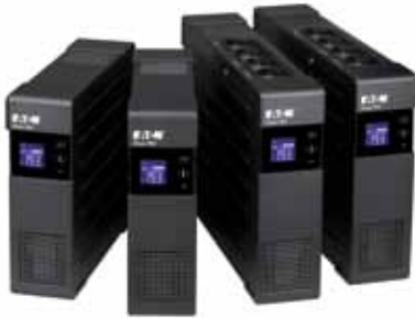
Моделни Ellipse Pro