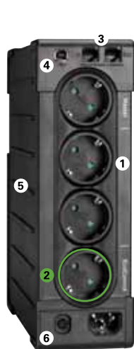
Eaton Ellipse PRO 650